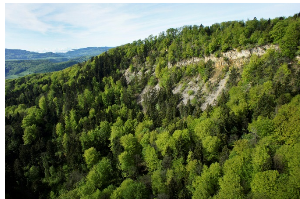
Kalkflühe aus Hauptrogenstein