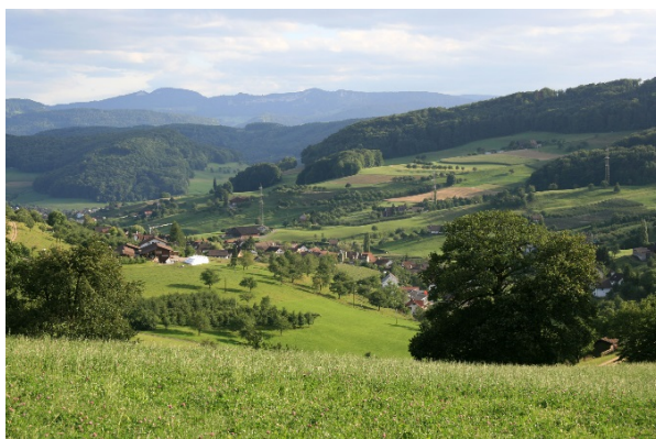
Tafelfläche mit der Gemeinde Rickenbach