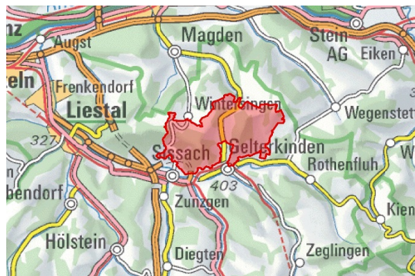
BLN 1104 Tafeljura nördlich von Gelterkinden